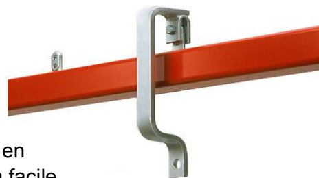
Pas de chaîne