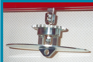
La rueda dentada

El Monorraíl de cadena serie 1000, puede estar equipado de dispositivos de rotación por cremallera dentada, o motor o rotación mecánica de 90° en 90°.